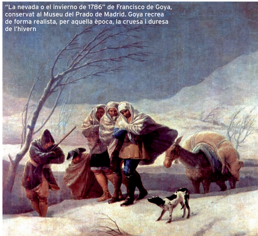
"La nevada o el invierno de 1786" de Francisco de Goya, conservat al Museu del Prado de Madrid. Goya recrea de forma realista, per aquella època, la cruïsa i duresa de l'hivern